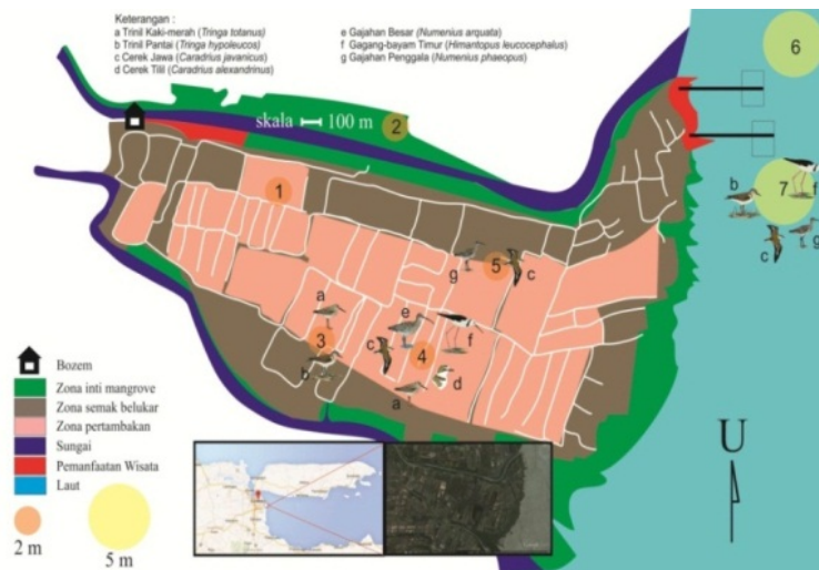
Gambar 2. Peta Wilayah Persebaran Burung Pantai di Wonorejo.

Berdasarkan gambar 2 dari 7 spot pengamatan, burung pantai hanya ditemukan pada spot 3, 4, 5, dan 7. Spot 1 tidak ditemukan adanya aktivitas yang dilakukan oleh burung pantai. Spot 1 merupakan area pertambakan yang sudah tidak aktif, digunakan sebagai lahan untuk pembiakan tanaman mangrove oleh petani mangrove disekitar wilayah Wonorejo. Selain itu, spot 1 berada di dekat pintu masuk bozem Wonorejo dimana terdapat banyak aktivitas antropogenik. Hal ini menilik pada pernyataan [16] yang menyatakan bahwa burung pantai sangat sensitif dengan keberadaan manusia.