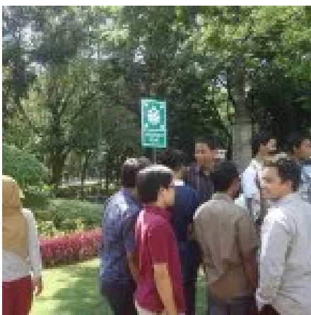
National Innovation Competition 2016 ( http://enviro.its.ac.id/?p=1308 )