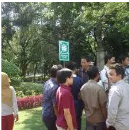
National Innovation Competition 2016 ( http://enviro.its.ac.id/?p=1308 )