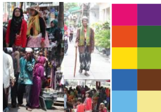
Gambar 3. Pemilihan warna audiens berdasarkan kultural

Penemuan warna didapat dari hasil studi literature, analisa objek, dan hasil focus group discussion . Landasan kriteria pemilihan warna dikarenakan khayalak/audiens memiliki selera atau keunikan sendiri dalam pemilihan warna. Mereka menyukai warna mencolok seperti merah, kuning, orange, hot pink /magenta yang dianggap sebagai simbol kekayaan, mewah dan glamour di kegiatan perayaan. Untuk kegiatan keagamaan, khayalak lebih banyak menggunakan chrome warna dingin seperti hijau, biru dan ungu. Berdasarkan riset, warna tersebut merupakan warna-warna yang mendekati juga dipengaruhi oleh budaya dan status sosial mereka.