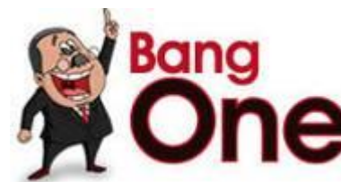
Gambar 4. Contoh gaya gambar maskot bang One

Pemilihan gaya gambar kartun dipilih agar dapat mendiskripsikan pola gesture, komposisi ruang dan hubungan di antara objek. Penganalisisan gaya gambar ini merupakan temuan dari ciri-ciri faktor psikologis, budaya/sosial, dan demografis target audiens pada halaman sebelumnya.