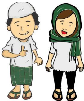
Gambar 7. Contoh busana maskot di bulan Ramadhan

Pengkondisional pembuatan karakter desain maskot juga dilakukan agar dapat menyesuaikan event dengan musim yang sedang berlangsung seperti bulan ramadhan atau musim liburan.