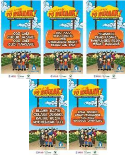
Gambar 10. Implementasi parikan pada outdoor banner