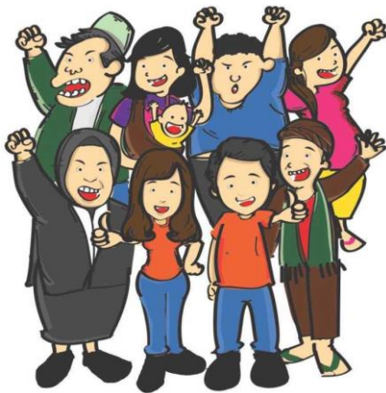
Gambar 8. Maskot dan karakter desain

Selain karakter tersebut, terdapat pula sosok pelaku yang berpengaruh dan cukup dikenal oleh masyarakat dan dianggap sebagai salah satu sosok yang paling dipanuti oleh masyarakat, yaitu ibu Tri Rismaharini. Tak hanya itu, karakter masyarakat dan sosok seperti tokoh agama juga di desain karena pada analisis sebelumnya karakteristik audiens merupakan sosok yang religius dan masih memegang teguh budayanya.