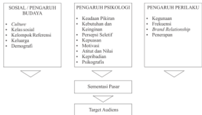
Gambar 2. Bagan influences on consumer decision making

Berdasarkan analisis yang dilakukan peneliti, dapat disimpulkan bahwa pembawaan perilaku masyarakat disebabkan karena pengaruh budaya dan sosial egaliter Suroboyoan keras dan unknowledge . Oleh karena itu untuk merancang diperlukan sebuah social change campaign yang berorientasi pada tujuan – tujuan yang bersifat khusus dan umumnya berdimensi pada perubahan sosial. . Berikut adalah bagan pencapaian target audiens berdasarkan pengaruh pembentukan sikap dan perilaku :