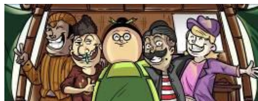
Gambar 5. Contoh gaya gambar karakter Indonesia

Dalam menggambarkan karakter desain, peneliti mengambil gambaran dari karakter Indonesia yang diadaptasi oleh ciri-ciri umum audiens yang apa adanya dan sedikit nyeleneh. Selain itu, karakter nantinya juga akan ditampilkan suasana lingkungan yang menjadi ciri khas mereka.