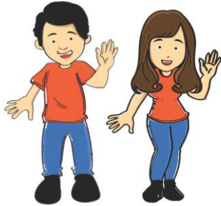
Gambar 6. Karakter maskot

Pengkondisional pembuatan karakter desain maskot juga dilakukan agar dapat menyesuaikan event dengan musim yang sedang berlangsung seperti bulan ramadhan atau musim liburan.