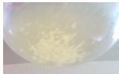
Gambar 3. Padatan PHA hasil evaporasi.

Pemisahan PHA dari sel dilakukan dengan metode refluks yaitu mengekstrak sel menggunakan pelarut tertentu sehingga PHA dapat keluar dari sel. Biomassa kering sebanyak 0,2937 gram dihaluskan terlebih dahulu dengan mortar. Ini bertujuan untuk memperluas permukaan dari sel. Pelarut yang digunakan yaitu metanol:kloroform (1:2 v/v). Ekstraksi dilakukan selama 6 jam pada suhu 50°C kemudian dipisahkan antara filtrat dan residunya. Filtrat yang didapatkan kemudian dievaporasi sehingga didapatkan padatan PHA yang berupa serbuk berwarna putih seperti pada Gambar 3.