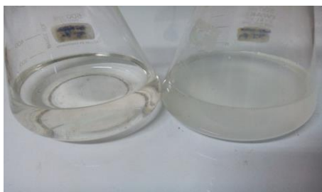
Gambar 2. Media hasil kultivasi sebelum inkubasi dan setelah inkubasi.

Biomassa bakteri R. pickettii diproduksi menggunakan metode fermentasi batch . Metode fermentasi batch yakni semua nutrisi dicampur langsung kedalam media pertumbuhan. Proses produksi biomassa R. pickettii diambil 10% media kultivasi sebagai prekultuur yang diinkubasi selama 24 jam. Hal ini bertujuan untuk mengadaptasi bakteri terhadap lingkungan media yang digunakan. Proses inkubasi dilakukan menggunakan shaker incubator yang bertujuan untuk memelihara bakteri pada jam tertentu dan menjaga kadar oksigen tetap ada di lingkungan media. Bakteri R. pickettii merupakan bakteri aerob sehingga keberadaan oksigen sangat diperlukan pada pertumbuhannya [4]. Prekultuur kemudian dipindah kedalam media kultivasi dengan volume 250 mL dan ditambahkan glukosa 5 mL dengan konsentrasi 3 mg/L. Inkubasi dilakukan selama 68 jam dengan kecepatan 150 rpm. Waktu inkubasi disesuaikan dengan waktu stationer bakteri karena pada waktu stationer ini jumlah sel yang hidup mencapai keadaan maksimum. Pada proses ini didapatkan media berubah warna dari tidak berwarna menjadi keruh (Gambar 2). Hal ini menandakan bahwa terdapat sel didalam media.