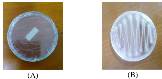
Gambar 1. Hasil pertumbuhan bakteri R. pickettii pada media agar (A) media minimal padat (B) Nutrien Agar

Pada Gambar 1 (A) menunjukkan bahwa bakteri R. pickettii dapat tumbuh dengan baik pada media minimal padat. Hal ini ditunjukkan pada hasil koloni yang berwarna putih pada permukaan agar. Jika dibandingkan dengan Gambar 1 (B), koloni putih dihasilkan lebih tebal pada media Nutrien Agar dibandingkan pada media minimal padat. Ini disebabkan kandungan nutrisi pada Nutrien Agar lebih kompleks dibandingkan pada media minimal padat sehingga sel bakteri yang dihasilkan lebih banyak dibandingkan dengan media minimal padat.