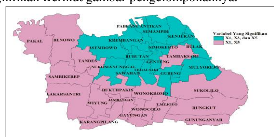
Gambar 2. Pengelompokan Kecamatan Berdasarkan Variabel Signifikan

Berdasarkan Tabel 7 didapatkan hasil pengelompokan sebanyak 2 kelompok berdasarkan variabel yang signifikan Berikut gambar pengelompokannya.