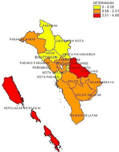
Gambar 1. Penyebaran angka buta huruf di Provinsi Sumatera Barat

penyebaran angka buta huruf tiap Kabupaten/Kota di Provinsi Sumatera Barat.