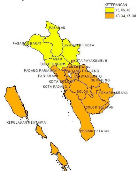
Gambar 3. Persebaran variabel signifikan menurut kabupaten/kota di Provinsi Sumatera Barat

Pengelompokan kabupaten/kota yang memiliki kesamaan variabel yang berpengaruh terhadap angka buta huruf dapat dilihat dari Gambar 2.