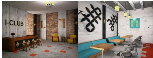
Gambar 6. 3D area front office dan I-Café