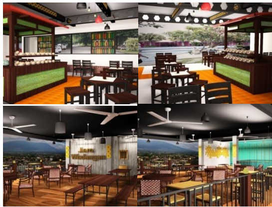
Gambar 7. 3D Jiero Wedanga

estetis seperti table number, lampu gantung dan beberapa elemen estetis menggunakan material besi dan stainless untuk menonjolkan kesan industrialis, sedangkan konsep Jawa diterapkan melalui penggunaan material seperti kaca kuno, poof motif batik, lantai tegel, dinding dari gebyok, puff kain beludru dan lain-lain. Warna yang digunakan juga mengadopsi warna-warna jawa seperti warna emas, orange dan hijau yang berarti kemakmuran. Elemen estetis berupa beberapa panel-panel besi berbentuk kawung berwarna kuning pada balok baja memberikan sentuhan etnik jawa. Pencahayaan dan penghawaan alami diaplikasikan melalui konsep ruangan yang terbuka dengan view taman dan kolam renang tanpa adanya dinding. Konsep terbuka ini juga diadaptasi dari konsep ruangan terbuka seperti rumah joglo.