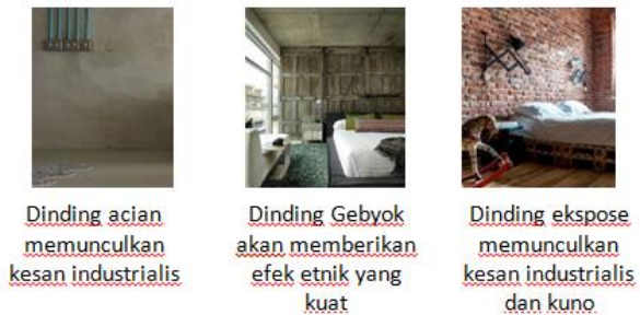
Gambar 3. Konsep Dinding