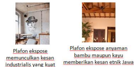
Gambar 4. Konsep Plafon