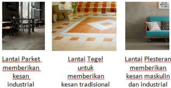
Gambar 2. Konsep Lantai