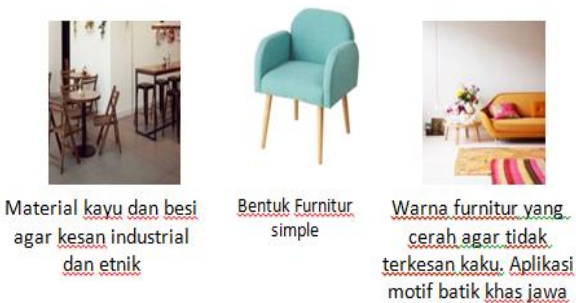
Gambar 5. Konsep Furnitur

mengenai topik pembahasan, mengetahui studi yang sudah pernah dilakukan serta mengetahui pendapat dan argumen peneliti lain mengenai perancangan pusat kebugaran dan café.