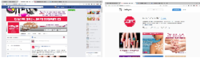
Gambar 2. Referensi Media Kampanye Online