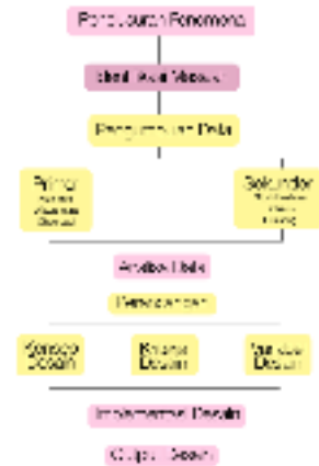
Gambar 3. Bagan Proses Perancangan