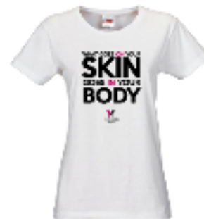
Gambar 9. Merchandise Kaos