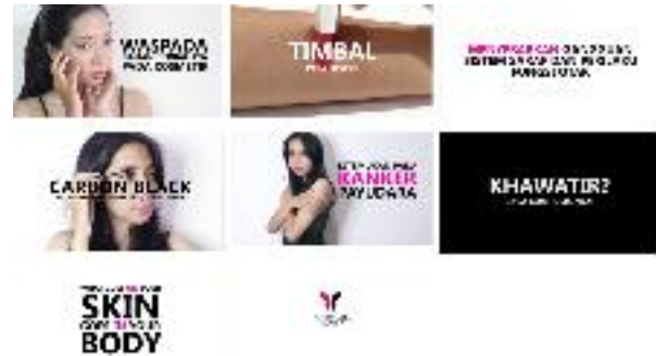
Gambar 5. Screenshot Video