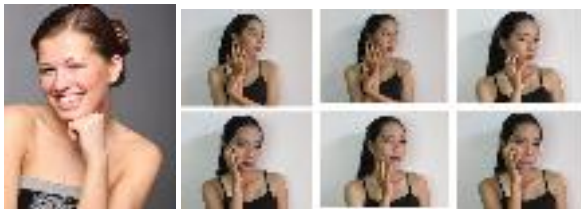
Gambar 4. Acuan (kiri) dan source foto model (kanan)

Aa Bb Cc Dd Ee Ff Gg Hh Ii Jj Kk Ll Mm Nn