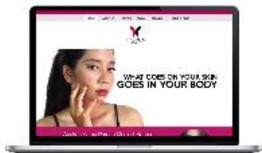
Gambar 8. Home Website Kampanye

Perancangan kampanye ini merupakan perancangan yang erat kaitannya dengan kosmetik. Berdasarkan studi literatur dan observasi yang dilakukan, untuk dapat menonjolkan kesan ngeri akan dampak bahan berbahaya pada kosmetik, maka teknik visualisasi yang digunakan menggunakan teknik fotografi.