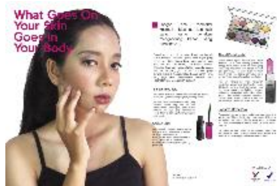
Gambar 6. Advertorial majalah

Konten dalam setiap media akan berbeda, sesuai dengan karakter masing-masing media. Kaitan dengan hasil analisis penelitian bahwa kampanye ini akan digunakan untuk membuat target audiens melakukan perubahan, sehingga konten yang ada dalam setiap media setidaknya dapat menginspirasi target audiens agar lebih bijak memilih kosmetik.