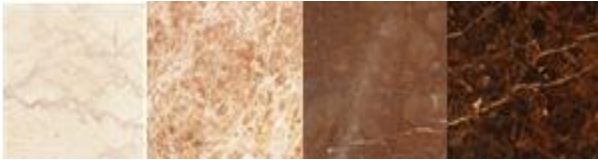
Gambar 2. Warna Lantai yang digunakan untuk ruang terpilih 1 dan 2