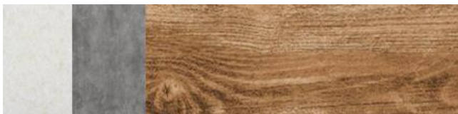
Gambar 3. Warna Lantai pada ruang terpilih 3