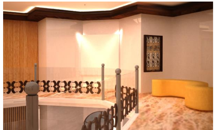
Gambar 7. Pengaplikasian Ukiran dan Lukisan Papua sebagai elemen estetis ruangan