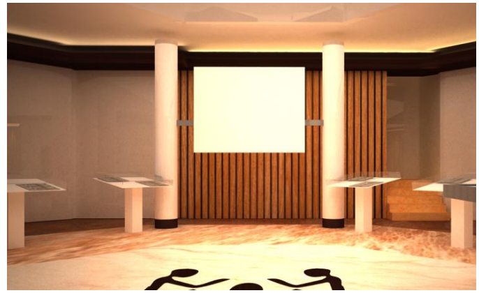
Gambar 6. Plafon pada Gedung Entrance