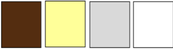
Gambar 1. Palet warna yang digunakan terinspirasi dari warna burung Cendrawasih