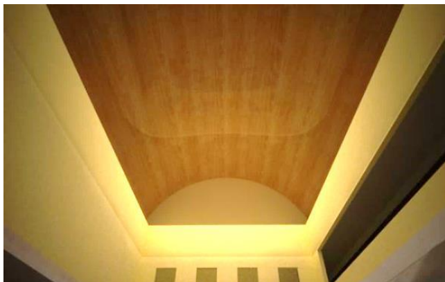
Gambar 5. Plafon pada Gedung Pamer