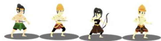
Gambar 6. Desain Karakter Postur Normal dan Chibi

atau menontonnya lagi berkali-kali. Berkaca dari serial televisi ini, Dinkin menyarankan para developer game F2P untuk mencari uang dengan cara bagaimana mereka mengintegrasikan karakter yang mereka buat seperti sutradara serial televisi tersebut mengintegrasikan karakternya ke dalam cerita. Jadi peneliti menyimpulkan bahwa dalam pembuatan karakter game sebaiknya menggunakan metode seakan – akan sebagai sutradara televisi.