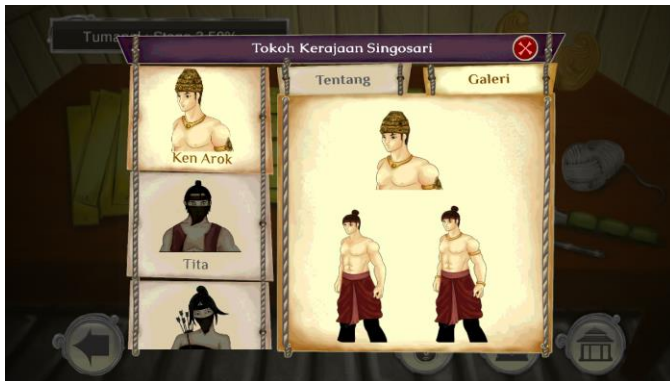
Gambar 14. Info karakter