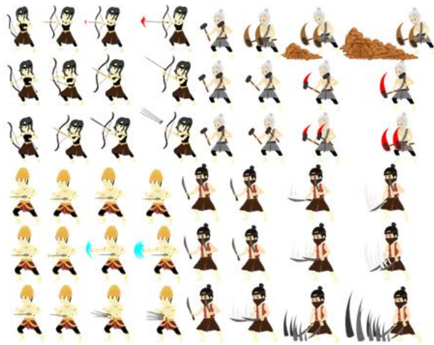
Gambar 7. Gestur Karakter