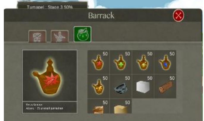
Gambar 10. Tampilan Choose Karakter