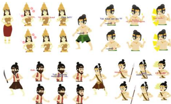
Gambar 8. Ekspresi Karakter