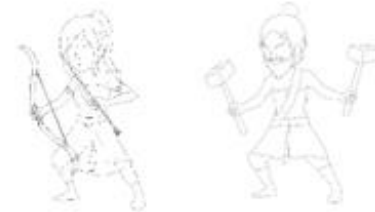
Gambar 4. Sketsa Karakter