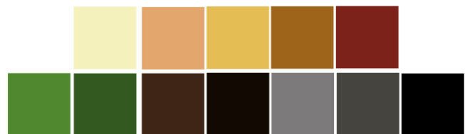
Gambar 5. Tone Warna