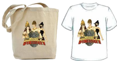
Gambar 16. Implementasi Merchandise

visual dengan terpengaruh oleh gaya gambar yaitu gaya Manga Chibi. Gaya ini memiliki persentase terbesar namun tentunya tanpa menghilangkan komponen dari identitas sejarah berdirinya Kerajaan Singosari itu sendiri. Selain itu gaya penyampainnya menggunakan gaya ilustrasi vektor. Penggambaran karakter yang dieksekusi menggunakan teknik vector dengan gaya gambar yang tidak terlalu realis juga akan dapat dengan mudah diterima para remaja.