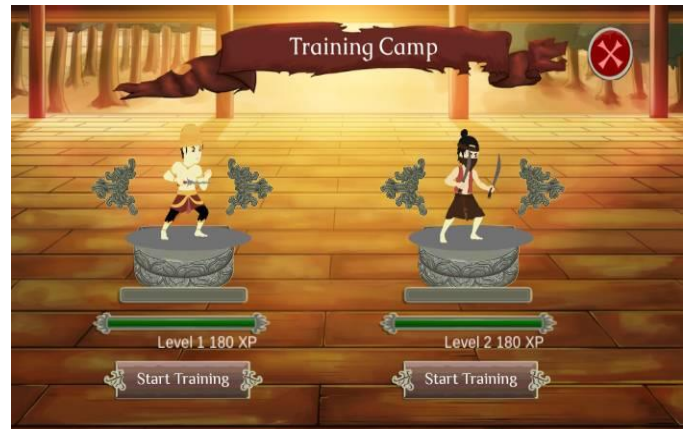
Gambar 12. Training Camp