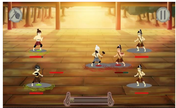
Gambar 11. Gameplay