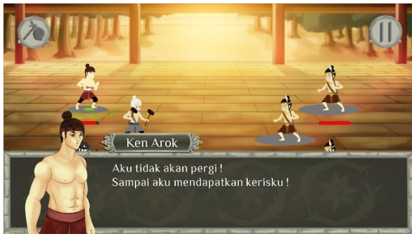
Gambar 9. Tampilan Dialog Box

perpaduan (kohesivitas), pengulangan (repeatability), kepribadian dan keunikan.[2] Bagaimana karakter-karakter tersebut tampil dalam bentuk dan keunikannya sendiri, tetap menjaga kesederhanaan meski dalam bentuk yang agak rumit, mudah diingat, dan berkesan hidup. Dalam game ini peneliti ingin menyampaikan sejarah melalui desain karakter dan yang diadopsi dari sejarah kerajaan Singosari. Dengan penggambaran karakter dan yang tepat maka diharapkan mampu membangkitkan gambaran historis dan nilai – nilai budaya dari kerajaan Singosari tersebut. Sosok raja pada masa berdirinya Singosari memiliki cerita yang sangat menarik karena ia bukan dari golongan atas (melainkan kelas sudra). Dia dianggap mendobrak sebuah alur tumpu pemerintahan di era itu.[3] Responden memilih penyampaian