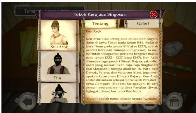
Gambar 13. Info sejarah Karakter