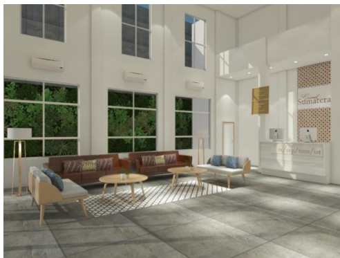
Gambar 3. Hasil Desain Akhir Area Lobby