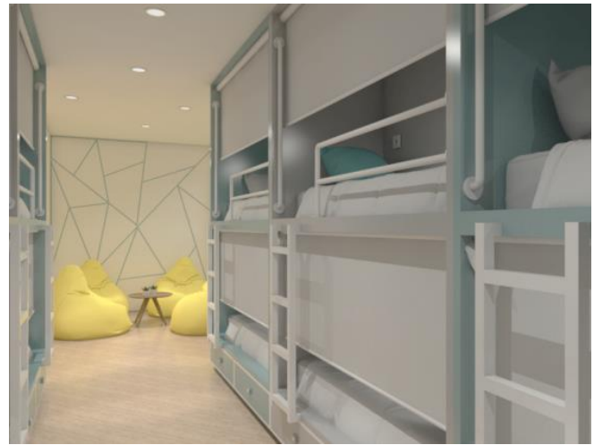
Gambar 3. Hasil Desain Akhir Area Kamar Hotel

Konsep dari Scandinavian lekat dengan gaya desain industrial dan minimalis dan juga disebut desain yang bersih