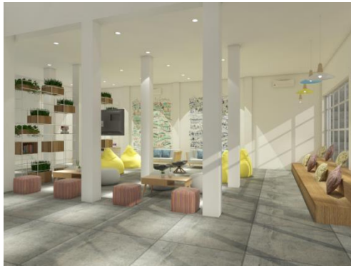
Gambar 2. Hasil Desain Akhir Area Lounge