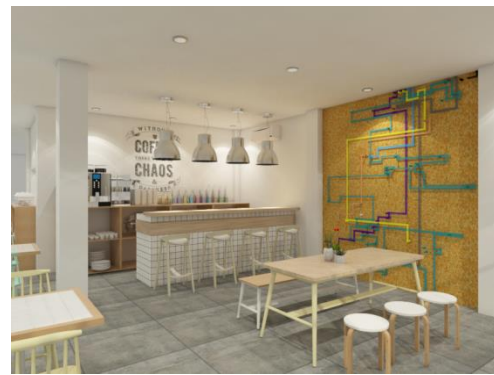
Gambar 4. Hasil Desain Akhir Area Makan

dan efektif. Keseluruhan gayanya adalah perpaduan kesederhanaan dengan kenyamanan yang menawan, menarik dan nyaman. Tampilannya kasual yang merupakan ide-ide desain baru dengan tampilan yang lebih tua. Biasanya dicirikan dengan nuansa yang cerah, bersih dengan banyak item menarik. Untuk furniture, dalam scandinavian ini lebih menonjolkan unsur-unsur alam seperti kayu, besi, dan lain-lain. Konsep scandinavian ini juga mengusung konsep ramah lingkungan. Sehingga pemakaian energi listrik akan diminimalisir diganti dengan bukaan-bukaan jendelanya yang besar yang cocok jika dipadukan dengan konsep eco green living tersebut. Nuansa Indonesia juga memberikan identitas pada hotel yang dibangun di Surabaya, Indonesia. Para konsumen hotel dapat merasakan nuansa Indonesia yang dikemas dengan konsep modern di interior hotel tersebut.