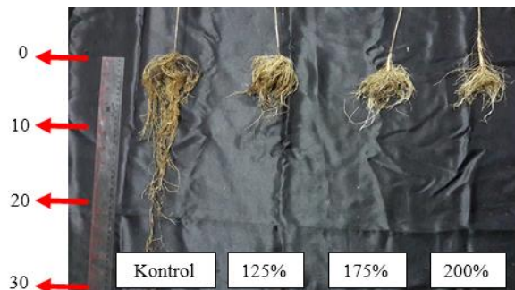
Gambar 1. Panjang Akar Tanaman Kedelai Varietas Grobogan Setelah 14 Hari Perlakuan. Berturut-turut 100%, 125%, 150% dan 200%.