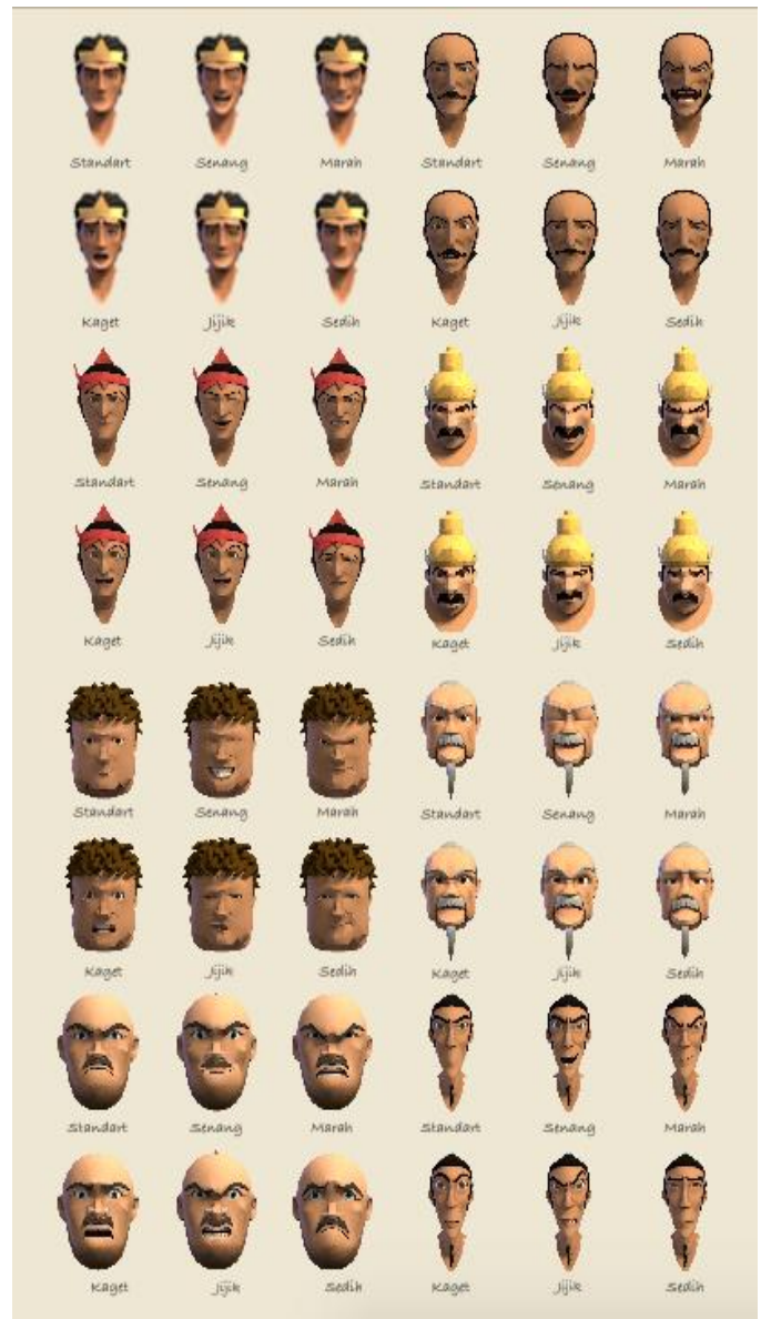
Gambar 8. Ekspresi masing-masing karakter.