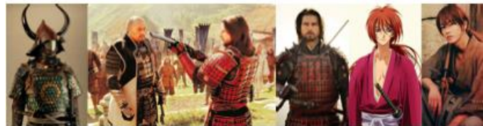
Gambar 4. Perbandingan antara baju asli dengan baju di dalam film.

yang akan digerakkan mendekati proporsi manusia. Oleh karena itu harus ditentukan gaya gambar yang memiliki proporsi mendekati manusia namun tidak terlalu realis sehingga lebih disukai anak-anak. Gaya gambar yang memenuhi kriteria tersebut adalah gaya gambar stylized. Gaya gambar stylized memiliki bentuk proporsi yang mirip dengan manusia namun tidak terlalu realis