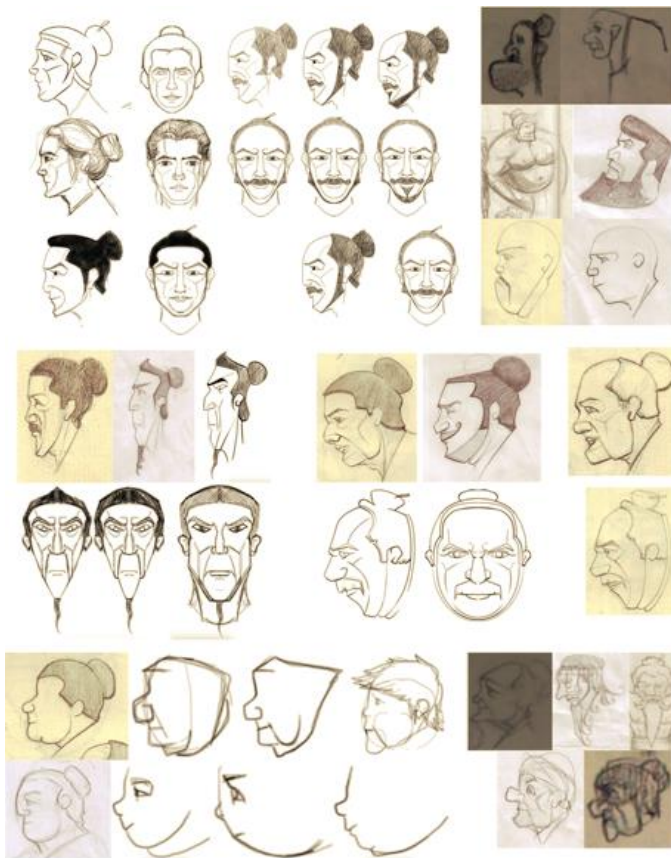
Gambar 5. Sketsa wajah karakter.