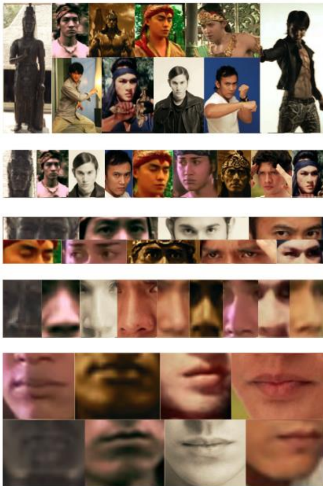
Gambar 2. Moodboard karakter