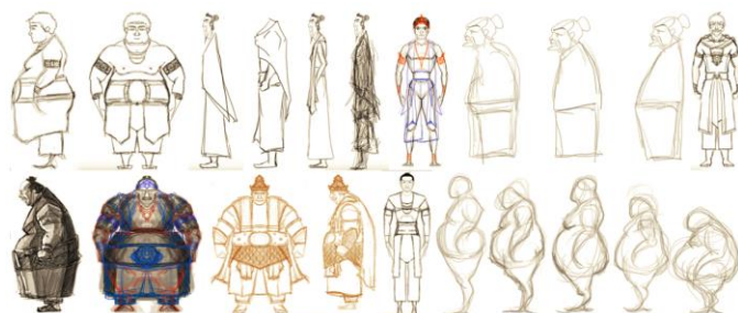
Gambar 6. Sketsa proporsi karakter.