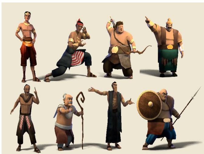
Gambar 7. Hasil akhir desain 3D.