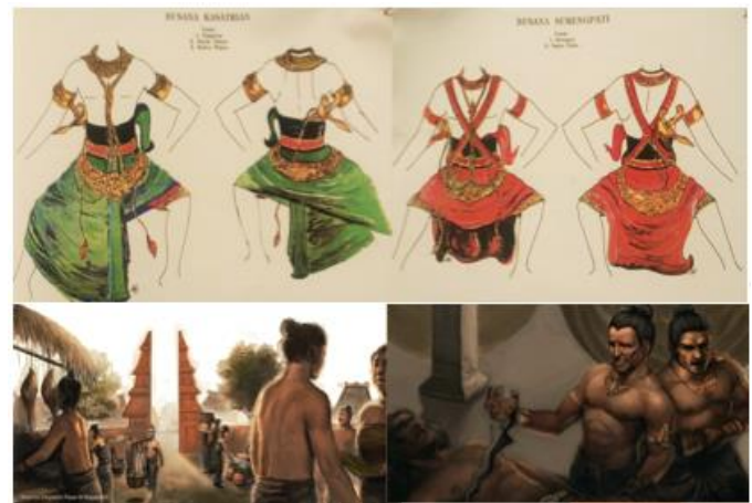
Gambar 3. Model baju pada jaman kerajaan majapahit dari buku Banjaran Majapahit dan dari lukisan. [7]