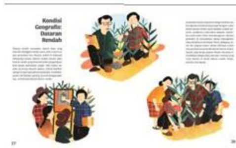
Gambar 12. Tone warna subtema 2