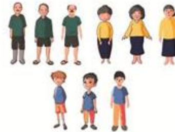
Gambar 4. Ilustrasi karakter dengan tiga alternatif gaya gambar