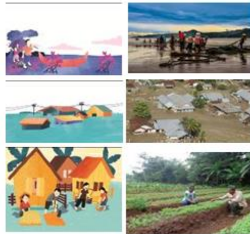
Gambar 5. Ilustrasi background yang digunakan dalam buku visual diperoleh dari referensi melalui internet