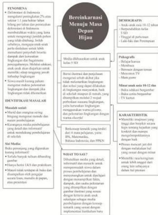
Gambar 2. Bagan konsep perancangan buku visual pelestarian lingkungan