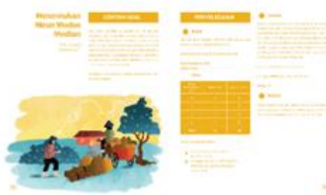
Gambar 7. Penerapan tipografi pada buku visual pelestarian lingkungan