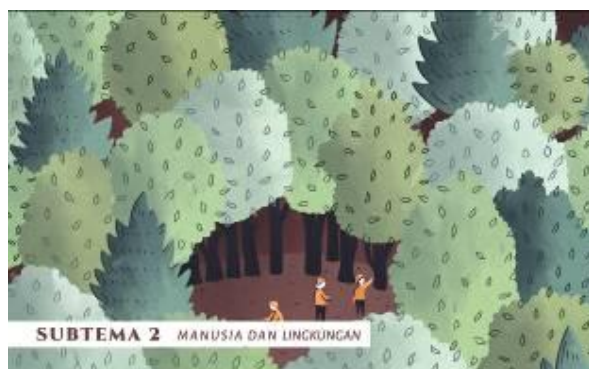
Gambar 9. Perwarnaan subtema 2