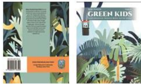
Gambar 3. Gambar cover buku visual pelestarian lingkungan berkonsep tematik