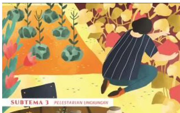
Gambar 10. Pewarnaan Subtema 3

menggunakan tone warna yang ceria untuk menghidupkan cerita dan suasana, serta ilustrasi jenis kartunis yang simple dan jelas. Sehingga, elemen yang harus ada dalam penyampaian ilustrasi mampu membuat anak-anak berimajinatif, memiliki rasa ingin tahu, aktif, dan suka