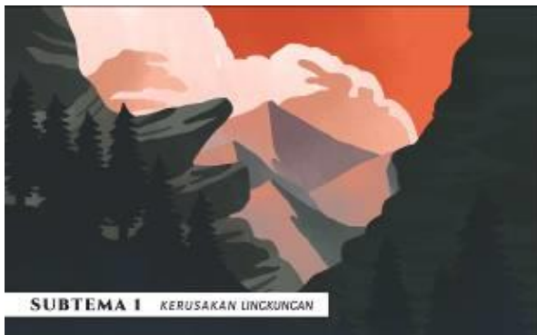
Gambar 8. Pewarnaan subtema 1