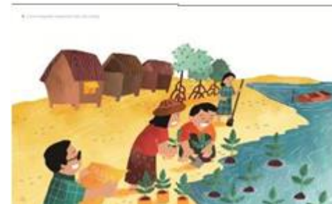
Gambar 13. Tone warna 3