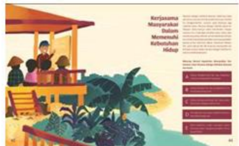
Gambar 6. Grid layout yang digunakan dalam perancangan buku visual pelestarian lingkungan