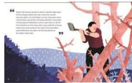
Gambar 11. Tone warna subtema 1