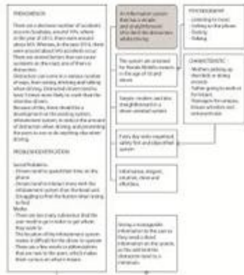
Gambar 3. Konsep UI/UX sistem Infotainment untuk Honda Mobilio