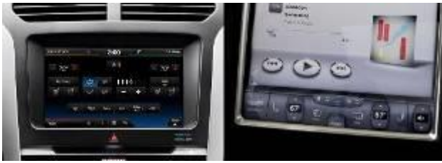
Gambar 1 Contoh dari UI berukuran kecil