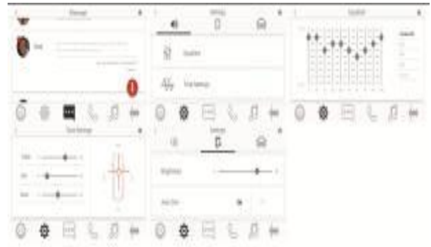
Gambar 6. Digitalisasi Black on white sistem informasi