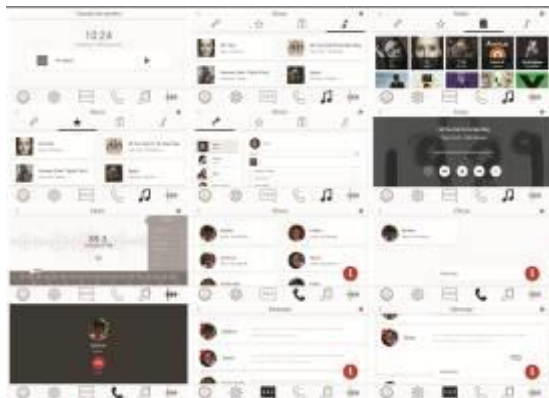
Gambar 5. Black on white menimbulkan kontras kepada informasi yang diberikan oleh sistem tersebut

Dengan munculnya fitur baru yang menghubungkan fitur satu dengan fitur lain, pengguna menginginkan akses yang lebih mudah dalam memperoleh informasi dan service seperti yang dimiliki oleh smartphone yang terdapat pada central head unit. Hal ini akan memberikan kesempatan baru bagi penyedia konten atau perangkat untuk membuat sesuatu yang baru, yang dapat membantu pengendara untuk mengurangi resiko terjadinya kecelakaan. Pengendara dan penumpang menggunakan fitur semacam ini, karena dapat memberikan service yang memiliki nilai lebih. Contohnya adalah, beberapa mobil dilengkapi dengan perangkat yang berasal dari fitur mobil itu sendiri, seperti collision warning system, assist parking, dan beberapa hal lain yang tidak dapat dihindari secara instan oleh pengendara saat mengemudi.