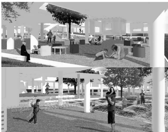
Gambar 6. Interior area bermain dan terapi

Untuk ruang luar dihadirkan dengan nuansa berbeda-beda sesuai fungsi dan penggunaanya. tempat untuk bermain bersama, untuk orang tua atau keluarga duduk bersantai bersosialisasi sesama anggota keluarga korban lainnya, ada yang dijadikan tempat beristirahat sejenak perawat, terapis dan pegawai, ada juga digunakan untuk tempat menyendiri bagi anak yang masih membutuhkan masa penyesuaian. Penggunaan unsur-unsur alam menjadi bagian penting, karena dapat menenangkan dan mendukung suasana kebersamaan. Seperti menghadirkan pepohonan yang rindang sebagai peneduh, suara aliran air yang berasal dari tirai air buatan. Konsep ruang luar juga memperhatikan bagaimana karakter dan suasana dapat menyembuhkan kondisi psikologis pengguna sehingga menjadi lebih tenang. Ruang Luar dihadirkan berbeda-beda sesuai fungsi dan pengguna, ada yang digunakan kelompok-kelompok kecil ada juga yang digunakan untuk kelompok besar, sehingga memiliki luasan yang berbeda-beda sesuai jenis aktivitas yang dilakukan.