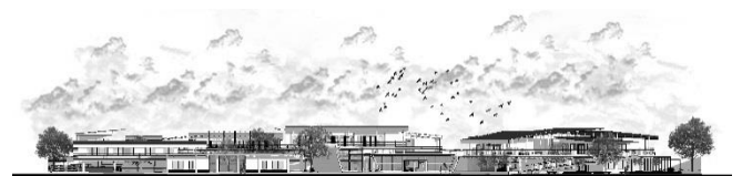
Gambar 4. Tampak Site Utara