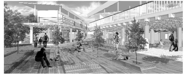
Gambar 8. Taman Kayu