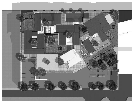
Gambar 3. Siteplan