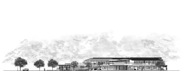
Gambar 5. Tampak Site Timur