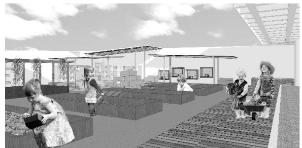
Gambar 9. Kebun