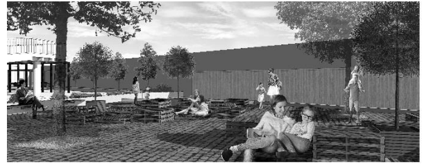
Gambar 7. Taman untuk Kunjungan Keluarga