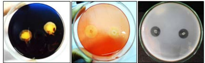
Gambar. 3. Hasil uji kualitatif amilolitik, selulolitik dan proteolitik pada isolat C5.

Hasil degradasi medium oleh enzim selulase terlihat sebagai zona bening setelah ditambahkan pewarna Congo Red 0,1% dan pembilasan dengan NaCl 1% untuk menghilangkan warna, sedangkan medium agar yang masih mengandung selulosa terlihat berwarna merah karena adanya ikatan dengan pewarna Congo Red 0,1% (Gambar 4).