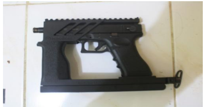
Gambar. 6. Posisi saat senapan dilipat.