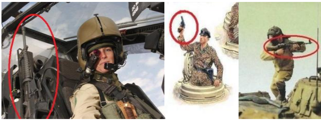
Gambar2. 1: Kru Helikopter meletakkan senapan M4 disamping kursinya. No. 2:Kru tank Jerman dengan pistol Luger 9mm. No.3: Kru tank Rusia dengan senapan AK-74 [3].

Namun, laras pendek saja belum cukup. Bentuk senapan yang tidak simpel dan siluetnya yang bergelombang, beresiko tersangkut benda lain atau personel lain. Apalagi posisi mereka berada dalam sebuah ruang atau tempat yang terbatas (didalam ranpur), memakan banyak tempat jika sembarang menaruh atau membawanya. Posisi senapan yang tidak boleh sembarangan menaruhnya, khawatir senapan akan macet atau rusak juga sedikit menyusahkan personel. Dalam keadaan senapan rusak maka senapan bukan sebagai penolong, malah semakin membebani personel. Tidak jarang prajurit di dalam ranpur malah lebih menghawatirkan kondisi senapannya daripada kendaraan tempur itu sendiri. Hal ini juga ikut membuat personel tidak dapat berkonsentrasi dengan baik pada laju ranpur saat berjalan atau bertempur [4].