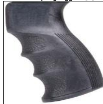
Gambar 3. Floating Vertical Grip [5].

Menggunakan grip dengan karakteristik Floating Vertical agar aktifitas membawa, menembak, mengambil dengan cepat dan menggenggam dapat lebih nyaman dan lebih lama dilakukan. Floating Vertical terpilih karena memiliki kemiringan sekitar 85° dan memiliki kontur halus sehingga lebih mantap digenggam [4].