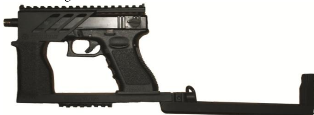
Gambar. 5. Posisi saat senapan diurai.

Mengacu pada sketsa yang terpilih, maka desain akhirnya adalah sebagai berikut