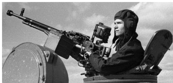
Gambar 1. Senapan mesin DShK kaliber 12,7 mm pada Tank T72 adalah senjata utama kru tank. [2].

Alat pertahanan diri yang cocok dalam kondisi seperti ini adalah senapan jenis SMG (Sub Machine Gun). SMG adalah singkatan dari Sub Machine Gun. SMG berawal dari ide senapan yang berkemampuan otomatis tetapi dengan peluru yang ringan (peluru yang digunakan adalah peluru pistol) sehingga tembaknya mudah dikontrol untuk jarak pendek. Keuntungan SMG adalah daya tembak otomatisnya mampu untuk mempertahankan diri dari sergapan atau kejaran musuh. SMG juga identik dengan dimensinya yang kecil. Dengan dimensi dan laras pendek, prajurit dapat membawanya dengan saat berada di dalam ranpur. SMG yang paling populer dengan kaliber 9x19 mm Parabellum, seperti Uzi, Mp 5, Mp 40, M3 Greaser dan Sten [1].