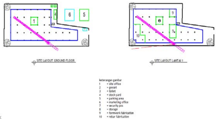
Gambar 2. Site Layout Proyek

Survey lokasi proyek dilakukan pada proyek pembangunan hotel A di wilayah Surabaya. Survey dilakukan untuk memperoleh data tata letak fasilitas dan ukuran tiap-tiap fasilitas, jarak antar fasilitas, frekuensi perpindahan antar fasilitas, serta identifikasi safety index. Dari hasil survey yang dilakukan melalui proses pengamatan di lapangan dan wawancara dengan project manager pada proyek tersebut, maka diperoleh Jumlah fasilitas yang tersedia berjumlah 9 fasilitas yaitu site office, storage, parking area, rebar fabrication, formwork fabrication, genset, toilet, barak, dan stock yard. Berikut merupakan gambar site layout dari hasil survey