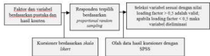
Gambar 2. Proses Confirmatory Factor Analysis

Untuk menganalisis faktor penentu pengembangan indsutri pengolahan perikanan dilakukan teknik analisis CFA ( Confirmatory Factor Analysis ). Analisis ini bertujuan untuk mengkonfirmasi keterkaitan antar variabel dalam faktor. Data yang digunakan untuk analisis ini adalah hasil kuesioner responden yang dirumuskan dengan skala likert .