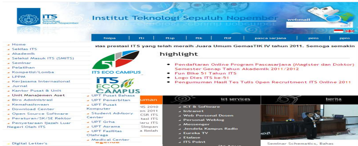
Gambar. 2. Halaman portal ITS (kondisi eksisting) [3]

apa yang mereka dapatkan. Dalam penelitian website ITS ini, bisa dikatakan semua atribut belum ada yang memenuhi harapan dari pengguna.