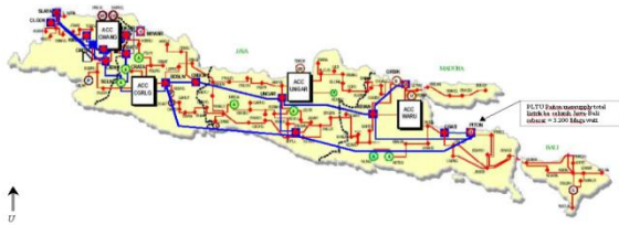
Gambar 1. Peta Lokasi PLTU Paiton-probolinggo

PT. IPMOMI PAITON berada di desa Bhinor, kecamatan Paiton, provinsi Jawa Timur. Seperti pada gambar 1, lebih tepatnya di areal pembangkit listrik PLN Jl. Raya Surabaya – Situbondo Km. 141. Letak geografis PT. IPMOMI berada di pesisir pantai Utara Pulau Jawa, yang berdekatan dekat Selat Madura. 142 km ke arah tenggara Surabaya.