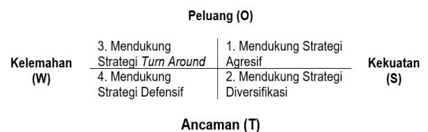
Gambar 1. Diagram analisis SWOT

Analisis aspek kelembagaan ini dilakukan dengan menggunakan analisis SWOT. Analisis SWOT ini bertujuan untuk menentukan teknologi yang dapat diterapkan yang sesuai dengan faktor SWOT di peternakan tersebut. Analisis SWOT ini dilakukan pada teknologi pengolahan biogas dan kompos. Data hasil kuisisioner tersebut dirumuskan 5-10 faktor strength (kekuatan), weakness (kelemahan), opportunity (peluang), dan threats (ancaman) dari masing-masing teknologi. Kemudian dibuat kuisisioner untuk menentukan penilaian bobot dan rating berdasarkan masing-masing faktor tersebut. Dari hasil kuisisioner penilaian bobot dan rating dilakukan perhitungan untuk menentukan bobot relatif dan skor. Perhitungan penentuan bobot relatif dan skor dilakukan berdasarkan faktor internal (S dan W) serta faktor eksternal (O dan T). Selanjutnya nilai faktor internal dan eksternal diplotkan ke diagram analisis SWOT [13]. Nilai x diperoleh dari selisih nilai total faktor internal, sedangkan nilai y diperoleh dari selisih nilai total faktor eksternal. Setelah diplot ke grafik maka dapat ditentukan strategi pengembangan yang akan dilakukan. Diagram analisis SWOT dapat dilihat pada Gambar 1. Faktor internal dan eksternal selanjutnya digunakan untuk merumuskan matriks SWOT. Pada matriks SWOT dirumuskan strategi yang diperoleh dengan menghubungkan faktor SO ( strength – opportunity ), ST ( strength – threats ), WO ( weakness – opportunity ), dan WT ( weakness – threats ). Matriks SWOT dapat dilihat pada Tabel 1.