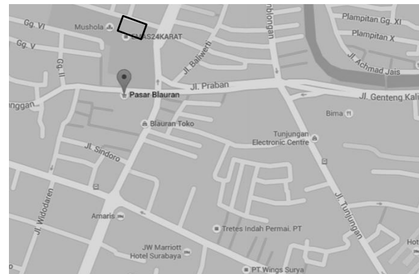
Gambar 1 Lokasi lahan pasar blauran

Analisa penggunaan lahan pada Pasar Blauran Surabaya menggunakan analisa penggunaan tertinggi dan terbaik yang terdiri dari beberapa aspek kriteria yaitu diizinkan oleh peraturan yang ada, memungkinkan secara fisik untuk dibangun, layak secara finansial dan memiliki produktivitas lahan maksimum [1]