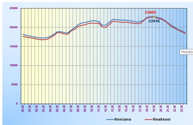
Gambar 2. Profil Beban Harian [3]

Beban pada sistem tenaga dibagi menjadi beberapa kawasan yaitu kawasan industri, komersial, dan residensial. Berdasarkan karakteristik beban pada masing masing kawasan, kebutuhan daya listrik selalu berubah ubah dalam satuan waktu.