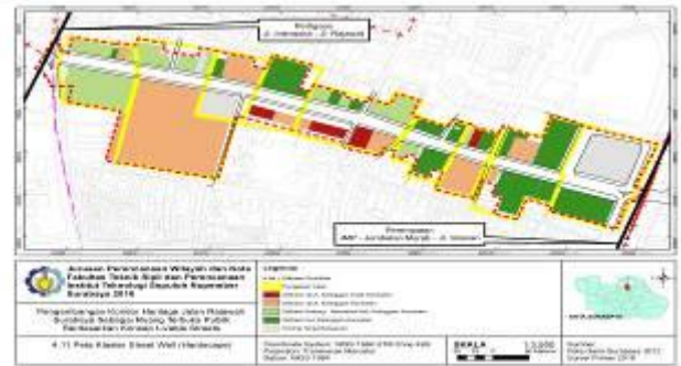
Gambar 2 Peta Hasil Overlay Street Wall

Proses dan tahapan analisis overlay dengan menggunakan software ArcGIS 10.1 pada peta ketinggian bangunan dan peta setback bangunan sebagai berikut: Tahapan Raster > Tahapan Overlay > Scale Value > Output Peta Overlay Street Wall (Hardscape) . Skoring data ketinggian dan data setback bangunan sebagai berikut: