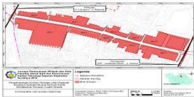
Gambar 1 Peta Blok Amatan