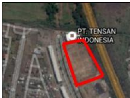
Gambar 3. Bentuk Lahan Objek Penelitian