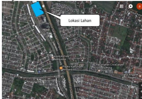
Gambar 2. Lokasi Objek Penelitian

Pada bab ini akan dibahas tentang hasil penelitian penggunaan properti yang menghasilkan nilai lahan tertinggi dari lahan seluas 12.835 m 2 yang terletak di Jl Kahuripan Raya Kav 30-34, Sidoarjo.