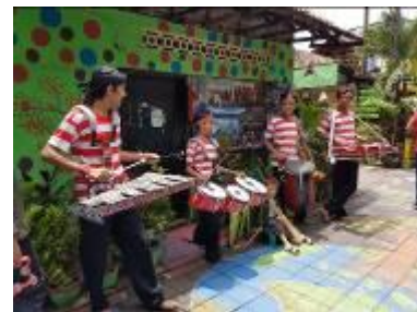
Gambar 3. Musik Patrol Kampung Lawas Maspati.