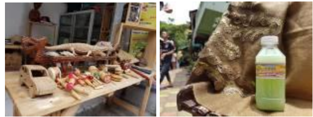
Gambar 2. Potensi Home Based Enterprises pada Kampung Lawas Maspati.

yang dapat dilakukan pada strategi ini adalah pengadaan pelatihan dan pendampingan secara berkala serta bantuan modal bagi pelaku usaha rumah tangga, dan peningkatan kualitas produk lokal Kampung Lawas Maspati.