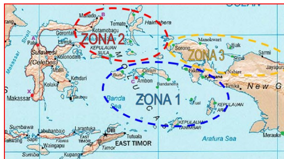
Gambar 1. Zona Distribusi Pengangkutan Semen

Berdasarkan metode tersebut pada penelitian ini dibagi menjadi 3 zona wilayah distribusi seperti Gambar 1 dibawah ini.