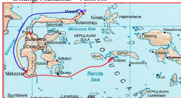
Gambar 2. Rute Skenario Pengangkutan Semen Curah

Gambar 2 menunjukkan bahwa pengangkutan semen dengan jenis semen curah menggunakan metode direct port dengan pelabuhan asal adalah Pelabuhan Khusus Biringkassi di Makassar dan pelabuhan tujuan adalah Pantoloan, Bitung, dan Ambon.