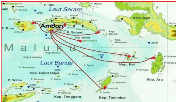
Gambar 3. Rute Skenario 2

Gambar 3 merupakan rute skenario dengan metode direct port dari pelabuhan utama adalah Pelabuhan Ambon, sedangkan pelabuhan konsumsi adalah Amahai, Banda, Geser, Tual, Saumlaki, Dobo, dan Namlea.