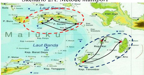
Gambar 4. Rute Skenario 2A

Gambar 4 menunjukkan rute skenario dengan titik konsumsi yang sama seperti yang ditunjukkan pada Gambar 3, perbedaannya adalah rute skenario 2A menggunakan metode multiport untuk mengangkut semen menuju titik konsumsi. Sehingga, kedua rute skenario ini dibandingkan untuk mendapatkan biaya transportasi yang lebih murah.