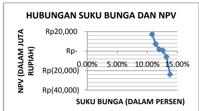
Gambar 3. Hubungan Suku Bunga dan NPV