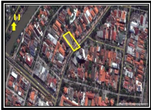
Gambar 1. Lokasi Objek Penelitian

dan peraturan-peraturan yang berkenaan dengan lingkungan [2].