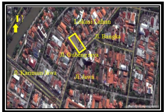
Gambar 3 . Site Plan Lahan Objek Penelitian

Berdasarkan data yang diperoleh, lahan objek penelitian ini memiliki ukuran 57.5 m x 20 m. Lahan tersebut memiliki bentuk persegi panjang yang mempermudah proses perencanaan pembangunan properti. Kemudian perlu diperhatikan jenis properti komersial yang akan didirikan pada lahan tersebut yang disesuaikan dengan luas lahan yang tersedia. Berikut merupakan site plan objek penelitian pada Gambar 3.