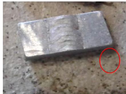
Gambar 1. Sudut atau pinggiran material yang telah ditiruskan mengurangi tegangan permukaan yang selalu cenderung mengurangi ketebalan cat pada sudut-sudut yang tajam dengan cara dibundarkan/ditiruskan.