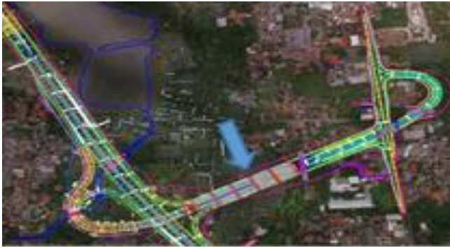
Gambar 2. Gerbang RE Martadinata

barrier pada gerbang RE Martadinata[3]. Berikut merupakan lokasi perencanaan gerbang tol pada jalan tol Serpong-Cinere seperti pada gambar 1.