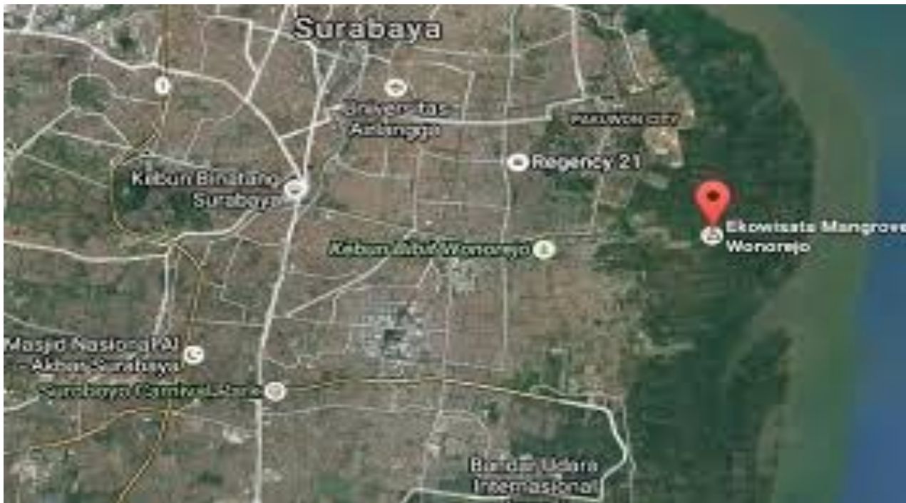
Gambar 1. Peta Mangrove Wonorejo.

Mangrove Wonorejo layak untuk dikunjungi oleh wisatawan. Eta Mangrove Wonorejo dapat dilihat pada Gambar 1. Tapi di satu sisi ekowisata Mangrove Wonorejo dilihat masih kurang memadai untuk daerah tujuan wisata oleh berbagai macam pengunjung, dikarenakan kurangnya perawatan dan kebersihan tempat tersebut, serta banyaknya jalan yang berlubang dan belum diaspal serta sempitnya jalan menuju objek wisata tersebut, kurangnya pemandu wisata di lokasi dan petunjuk arah menuju objek wisata dari jalan protokol dan lain lain. Sehingga beberapa hal tersebut dapat mengakibatkan berkurangnya minat para pengunjung dalam kota atau luar kota untuk menghabiskan waktu liburnya di objek wisata tersebut.